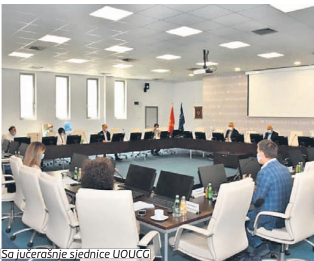
Sa jučerašnje sjednice UOUCG

Na sjednici su, između ostalog, usvojeni zapisnici sa prethodne tri elektronske sjednice i razmijenjene informacije o pojedinačnim zahtjevima studenata i nastavnog osoblja ka Upravnom odboru UCG. R.D.